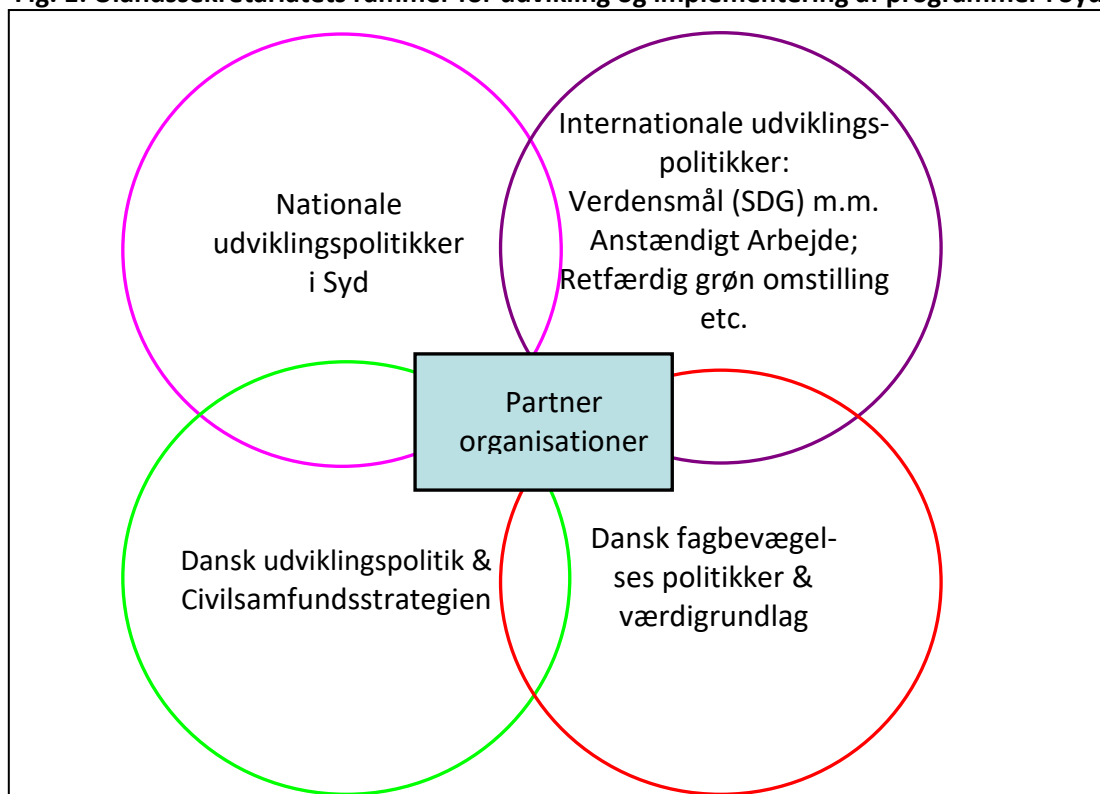
Fig. 1: Ulandssekretariatets rammer for udvikling og implementering af programmer i Syd.

Grundlaget for Ulandssekretariatets rettighedsbaserede udviklingsarbejde er FN's Menneskerettigheder § 23, § 24 og § 25. Disse paragraffer omhandler de fleste aspekter, som er forbundet med betingelser og vilkår på arbejdsmarkedet.