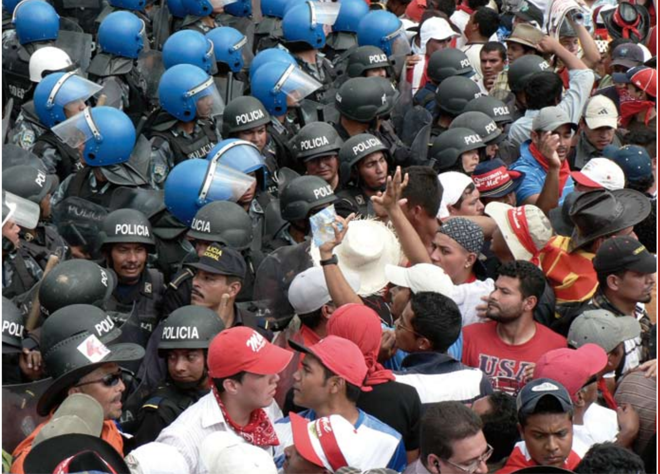
▲ Demonstranter er ofte blevet mødt med vold og brutalitet fra militæret og politiets side.