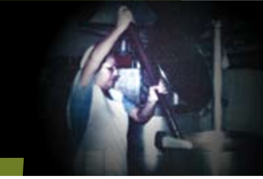
▲ I hospitalskøkkenet er det en daglig kamp at lave ordentlig mad, når fryserne ikke virker. I 30 graders varme.

beskytte sig mod støvet. Men ordentlige åndedrætsværn har de ikke. Og varmen gør det ulideligt at gå med en klud for næse og mund. Den varme, som ikke er til at få væk. Der er ingen ventilation – og da slet ingen aircondition. Meget af udsugningen fra de store tørretumblere går direkte ud i rummet.