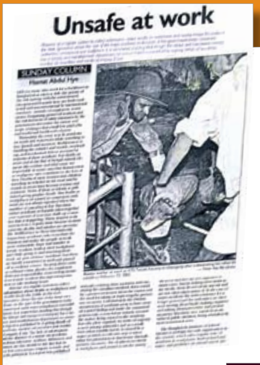
◀ BILS kaster lys over et sløret felt i Bangladesh: Farlige arbejdsforhold.